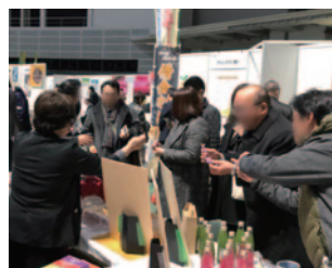
ブースでの商談風景

「農と食の展示・商談会2020」ホームページより、下記ご確認をお願いします 私は出展規約を確認し、同意の上申し込みます。 私は貴社の個人情報に関する利用目的を確認し、同意の上申し込みます。 https://www.saitama-noutoshoku.com/register/