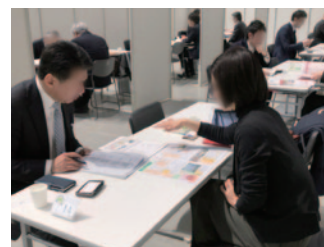
個別商談・相談会の様子