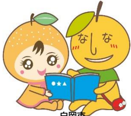
白岡市 マスコットキャラクター “なしりん” “なしべえ”

家の承継は「所有者」と「相続予定者」が共に考えるべき重要なテーマです。 「まだ元気だから」「子どもがどうするか分からない」と先送りしていると、 家は老朽化し、税金や管理の負担が増すばかり。 今のうちから、税制を活用した賢い家の引き継ぎ方を知っておくことが、 家族の安心と資産の有効活用につながります。