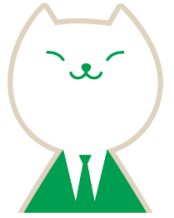
りそなグループ コミュニケーションキャラクター “りそにゃ”

家の承継は「所有者」と「相続予定者」が共に考えるべき重要なテーマです。 「まだ元気だから」「子どもがどうするか分からない」と先送りしていると、 家は老朽化し、税金や管理の負担が増すばかり。 今のうちから、税制を活用した賢い家の引き継ぎ方を知っておくことが、 家族の安心と資産の有効活用につながります。