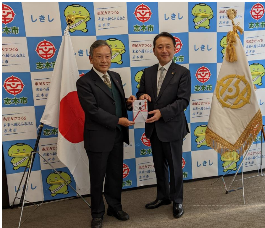
【2022年12月8日(木)志木市役所での贈呈式】(左から清水社長、香川市長)